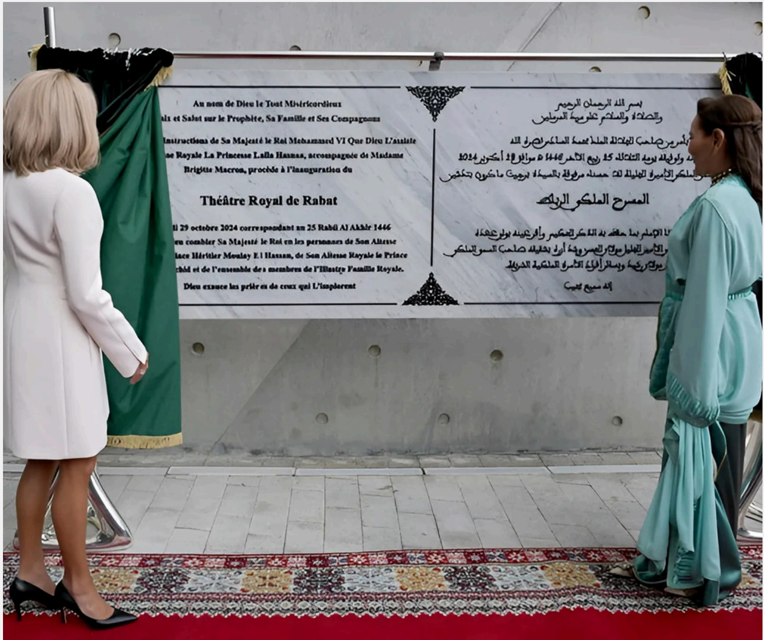
SAR la Princesse Lalla Hasnaa, accompagnée de Mme Brigitte Macron, inaugure le Théâtre Royal de Rabat